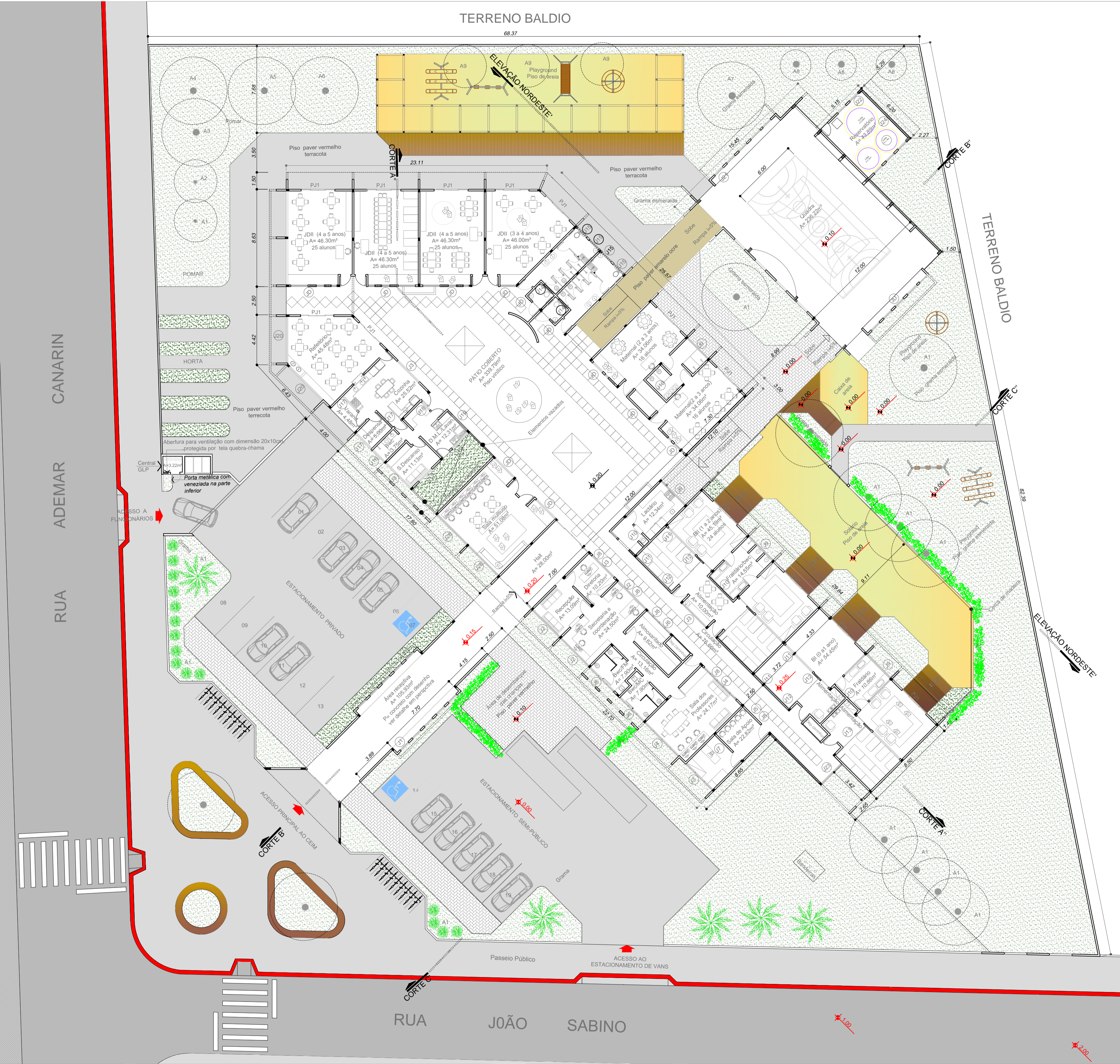
PLANTA BAIXA - escala: 1/250

Nas áreas internas as crianças costumam brincar muitas vezes em contato com o piso, principalmente quando começam a engatinhar e dar os primeiros passos, nesta perspectiva o tipo utilizado precisa ser de fácil limpeza e promover conforto térmico. Sendo assim serão utilizados pisos vinílico que além dessas vantagens alguns fabricantes já disponibilizam pisos com desenhos e cores específicos para cada projeto. Nos banheiros também esta sendo proposto os piso vinil antederrapante a base de pvc.